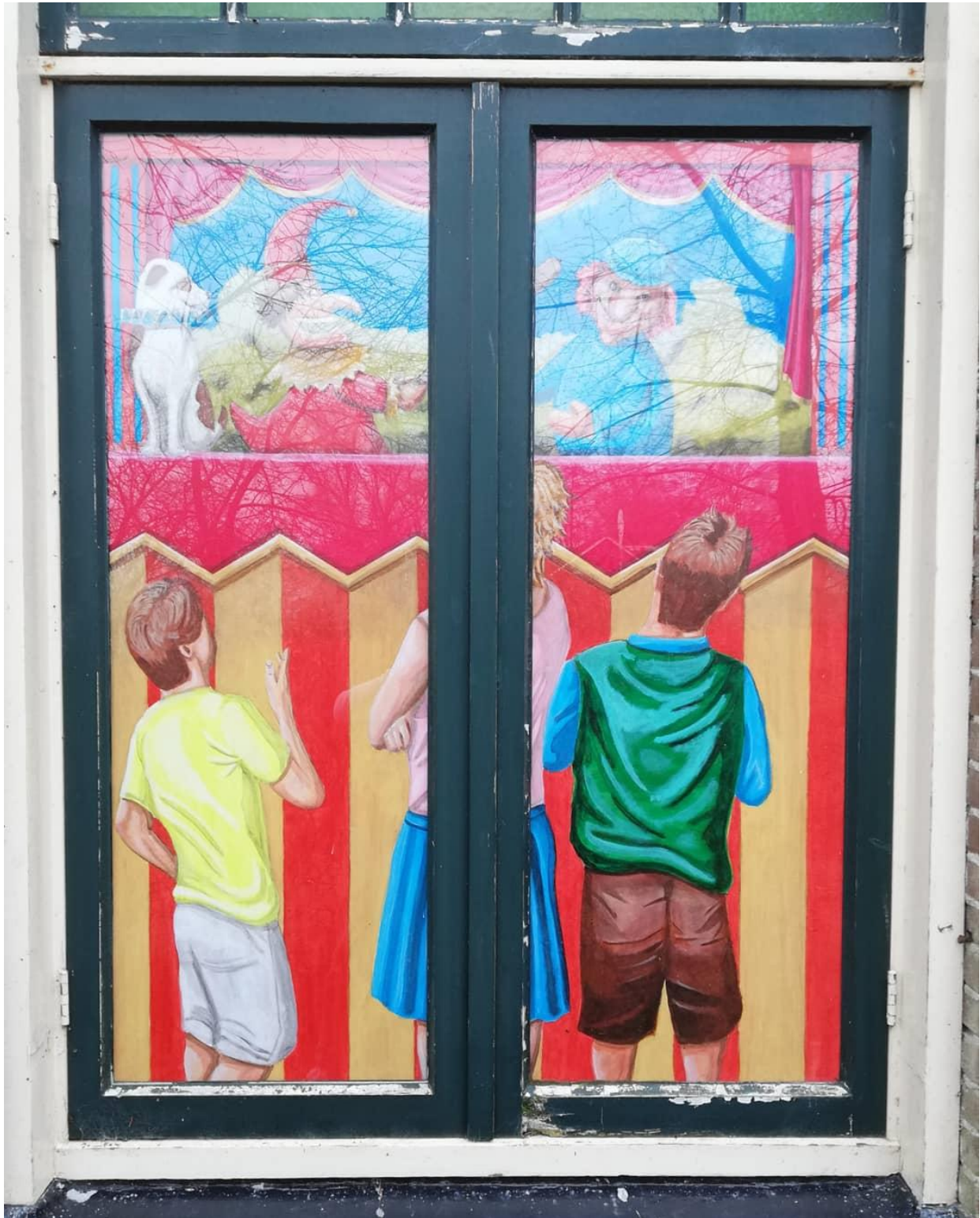
Poppenkastscène met handpoppen en publiek. Mr Punch, zijn vrouw Judy en Toby de hond. Oorspronkelijke afbeelding: detail Engelse spaarpot, twintigste eeuw. Briefkaart,

A hand puppet slides over the puppeteer's hand, who moves the puppet with his fingers. The puppeteer sticks his index finger in a hole in the bottom of the puppet's head. He sticks his thumb in one sleeve and his little finger - sometimes together with his ring and middle finger - in the other.