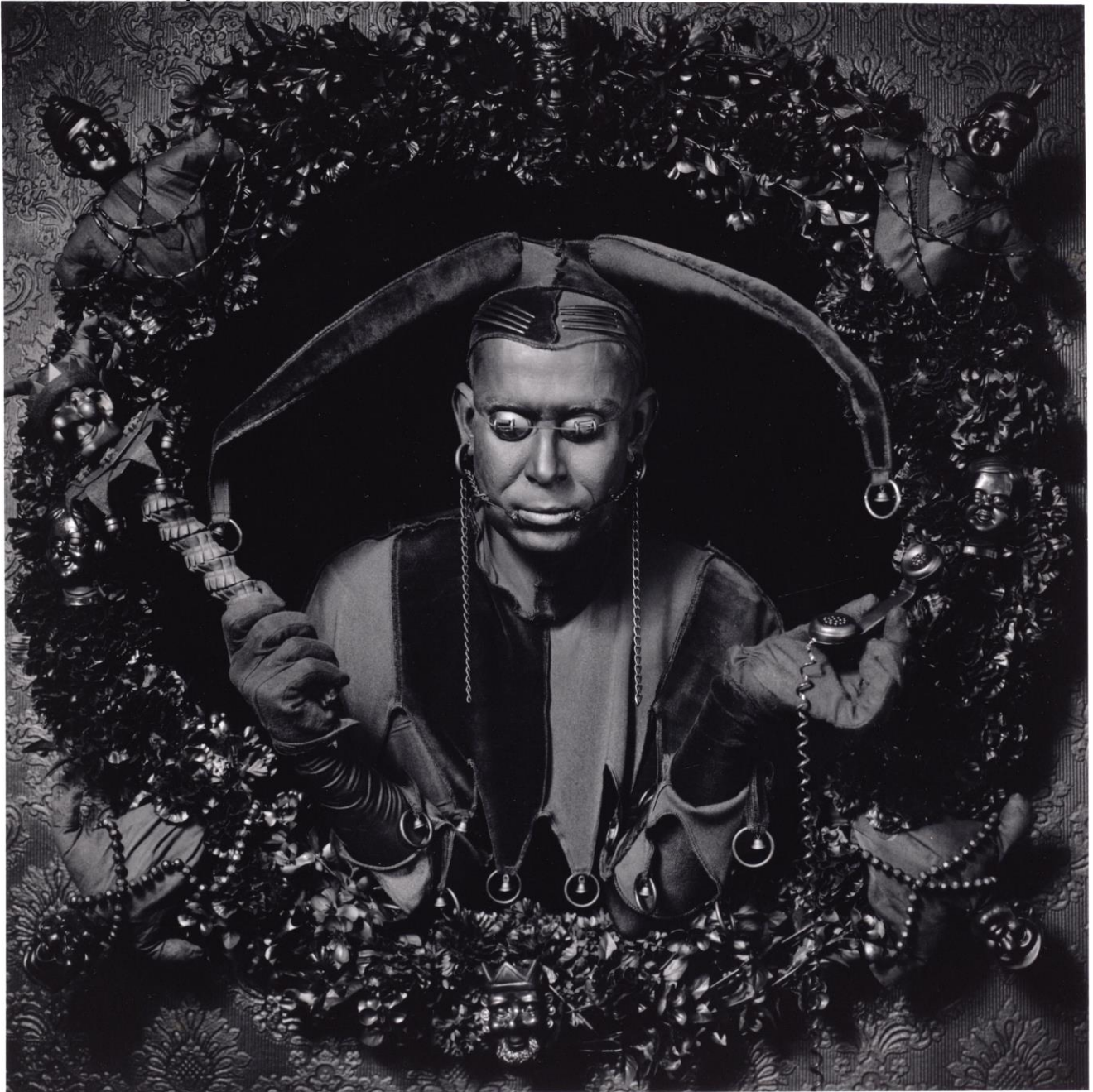
Foto uit de serie 'Blacks' van fotograaf en beeldend kunstenaar Erwin Olaf/Photo from the 'Blacks' series by Erwin Olaf, photographer and visual artist.

Titel/Title: '19 februari 1990'/'19 february 1990'.