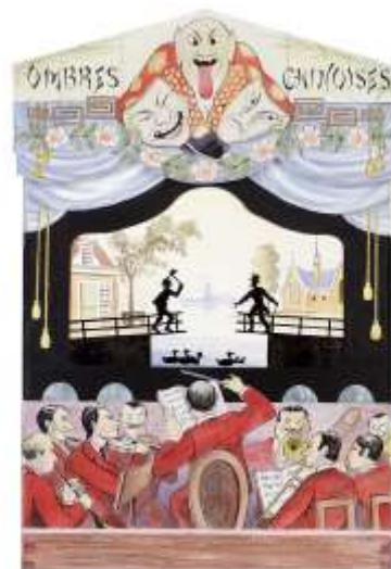
Afbeeldingen/Pictures I. Ombres chinoises: de chinese schimmen/Chinese shadow puppets: the 'ombres chinoises' [1, 3, 9]; Karaghiozis, Grieks schimmentheater/Greek shadow puppet theatre [2, 8]; Handschaduwfiguren/Hand shadow figures [4, 6]; Documentatie/Documentation 'Zelf eens proberen?'/DIY [5]; Vuurwerktheater: een aardig winteravondvermaak/Firework Theatre: amusement for a winter's evening [7]; Illustraties/Illustrations: Hetty Paërl [8, 9], Elsje Zwart [5]. Concept: Otto van der Mieden (2016).