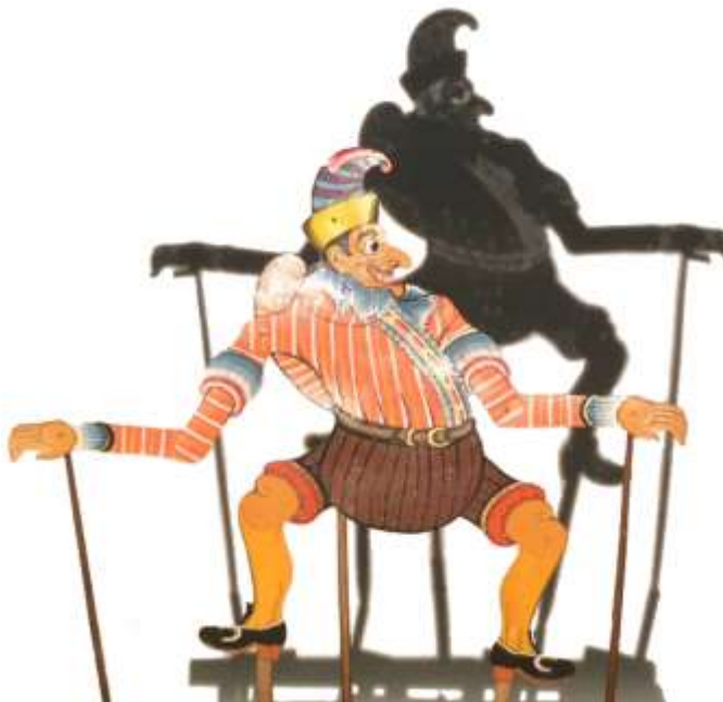
Afbeeldingen/Pictures III. Wayang-kulitfiguren/figures (punakawan e.a./et al). Van links naar rechts/from left to right: Petruk, Nala Gareng en/and Semar [1]; Dalang met/with Semar. Illustratie/Illustration: Elsje Zwart [2]; Mechanisch bewegende oud-Hollandse Jan Klaassen/Moving old-Dutch Jan Klaassen – wayang kulit. Pop/Puppet: Ledjar Soebroto [3]. Concept: Otto van der Mieden (2016).