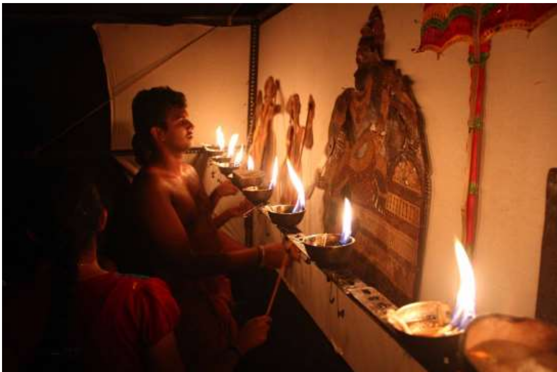
Afbeeldingen/Pictures IV. Pulavar: poppenpeler/puppeteer. Tholpavakoothu: schimmenspel/shadow play uit/from Kerala, India. Concept: Otto van der Mieden (2016).