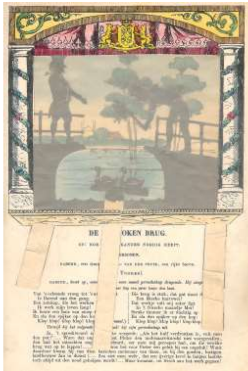
Afbeeldingen/Pictures II. Ombres chinoises/Chinese shadow puppets. 'De gebroken brug'/'The broken bridge'. Beweegbaar prentenboek/Moveable book: 'De van ouds bekende chinesche schimmen'. Impressum/Imprint: P.J. Trap (Leiden, ca. 1865). Concept: Otto van der Mieden (2016).