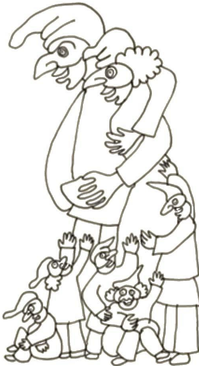
Afbeelding: illustratie van Pulcinella-figuren door Bruno Leone in 'La fine del mondo' – 'Het einde van de wereld' – 'The end of the world'.

Zie: http://www.poppenspelmuseumbibliotheek.nl/Pdf/lafinedelmondo.pdf .