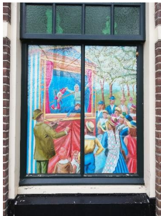
Afbeelding: raamdecoratie. Poppenkastafereel met de Franse Polichinelle. Buitenovertreders met vioolspelende muzikant en publiek. Oorspronkelijke afbeelding: boekillustratie, begin negentiende eeuw.

Zie: http://www.poppenspelmuseumbibliotheek.nl/pdf/zesraamaafbeeldingen.pdf .