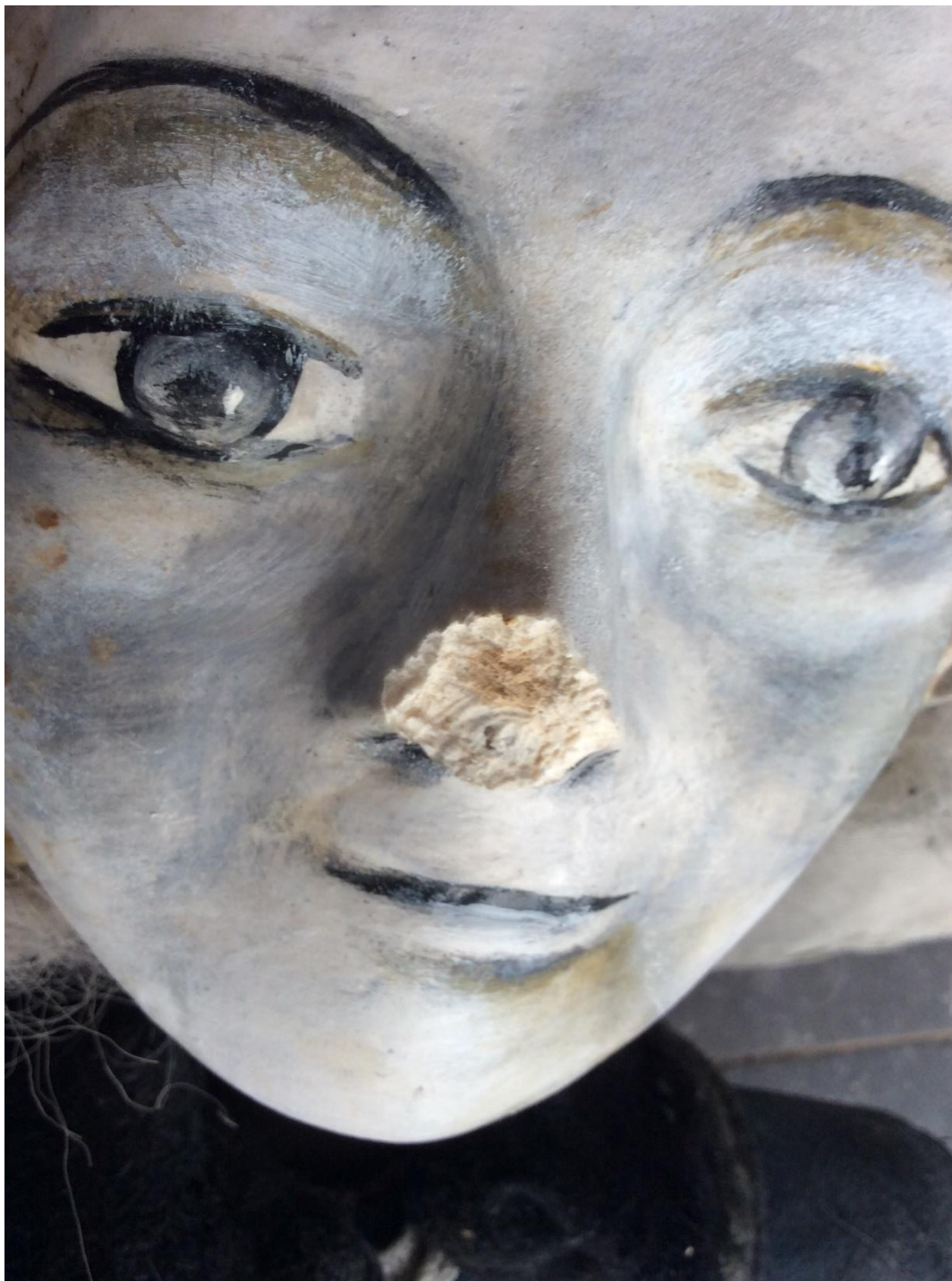
Afbeelding: neusschade bij aangevroten figuur door steenmarter. Tijdelijke bruikleen: collectie Speeltheater Holland.

Begin 2019 hebben diverse poppentheaterfiguren van Speeltheater Holland – die wij jaren daarvoor in bruikleen hadden gekregen – schade opgelopen in het depot. Veroorzaker: knaagwerkzaamheden door een steenmarter. Veel figuren waren behoorlijk aangetast. Mede dankzij het feit dat onze verzekering de schade dekde kon Speeltheater de figuren restaureren. De gehele poppentourage en hun archief zijn retour gegaan naar het Speeltheater.