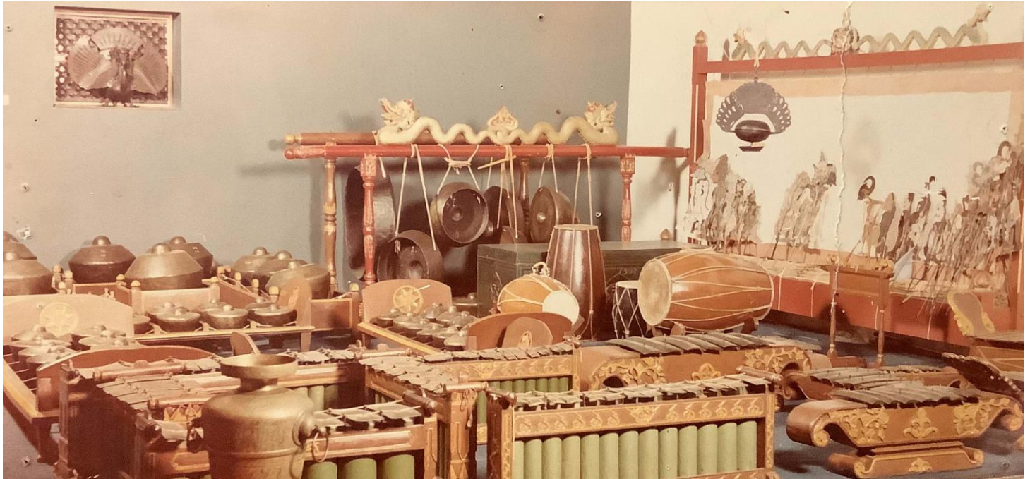
Afbeelding: gamelan-instrumentarium 'Kjai Paridjata'/'Heer levensboom' met wayangkult-figuren, Collectie voorheen museum Nusantara, Delft. Verwerving: Poppenspe(e)lmuseum (2019).