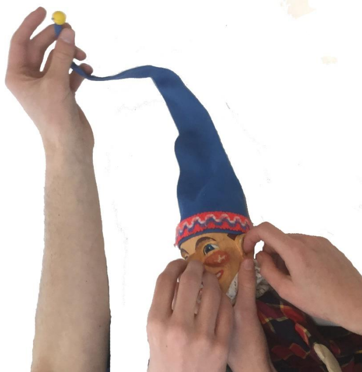
Afbeelding: museaal poppentheatererfgoedproject voor visueel beperkten 'Een kijkje in de poppenkast'. 'Bekijken' van Kasperfiguur. Duitse handpop ontworpen door Theo Eggenk (ca. 1950).

POPMUS wil niet alleen informatie over de individuele museale objecten aanbieden, maar vooral de context, m.a.w. de wortels van de objecten in de cultuur waaruit zij zijn voortgekomen. Digitalisering van de collecties, maar vooral van de kennis over de objecten, hun onderlinge relaties en hun oorspronkelijke culturele context is de basis voor een intensieve vorm van kennisoverdracht aan alle doelgroepen buiten de beperkingen van bereikbaarheid en openingstijden. Bovendien verdient het specifieke speelse, archetypische en artistieke karakter van het erfgoed een aanpak die in veel gevallen haaks staat op standaard museale presentatiepraktijken en die pas tot zijn recht komt in multimediale en interactieve omgevingen. Deze alternatieve presentatievormen zijn pas mogelijk na een verregaande en diepgaande digitalisering van onze collectie en het gebruik van contextuele kennis.