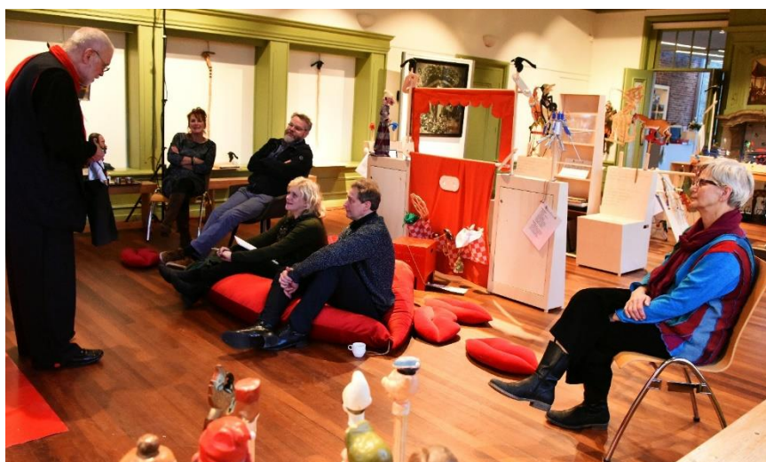
Afbeelding: sfeerbeeld expositie 'Een kijkje in de poppenkast' in de Schierstins te Feanwâlden.

Halverwege 2016 troffen wij voorbereidingen voor de realisatie van het tweetalige (reizend) project voor visueel gehandicapten in 2017/2022. De tentoonstelling 'Een kijkje in de poppenkast. Horen, voelen, doen en ontdekken: een tastbare ontmoeting met internationale en curieuze poppentheaterfiguren.' 'Sensory Puppetry – Seeing, hearing, feeling and exploring. A project on puppet theatre for visually impaired people' is in de periode 2017-2019 gerealiseerd. en zal zeker tot eind 2022 in het museum – maar ook elders – te zien zijn. Uitgangspunt: het toegankelijk maken van de poppentheatercollectie voor blinden en slechtzienden door middel van enkele poppentheaterfiguren en -objecten, teksten in grootletter/zwartschrift en braille en combi-schrift/dubbeldruk (synchroonlopend braille met drukletter), gesproken teksten, tactiele reliëftekeningen met als uitgangspunt illustraties van Elsje Zwart, film- en geluidsfragmenten, een fotowerk van Erwin Olaf, een object van Jan van Leeuwen, een replica van Sophie Taeuber-Arp, tactiele audioboeken, een voeltas, een speciaal servies, een Nederlands- en Engelstalige website met hyperlinks en een poppenspelletje. Voor meer informatie, zie: http://www.poppenspelmuseumbibliotheek.nl/blinden.aspx en http://www.poppenspelmuseumbibliotheek.nl/blinden_EN.aspx .