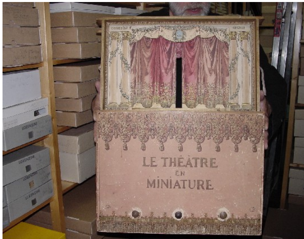
Frans miniatuurtheater

Aan het begin van de 20 ste eeuw ontwikkelden zich nieuwe, meer verfijnde vormen van het poppenspel. ‘Beeldend kunstenaars, musici, schrijvers en ook pedagogen ontdekten dat de pop eigen, zeer specifieke mogelijkheden heeft. Zij kozen het poppenspel als middel om zich te uiten en gingen het beroepsmatig beoefenen. (...) In de loop van deze eeuw is het poppenspel uitgegroeid tot een volwaardige, diverse stromingen omvattende theaterkunst, niet alleen voor kinderen maar ook voor volwassenen.’ 4