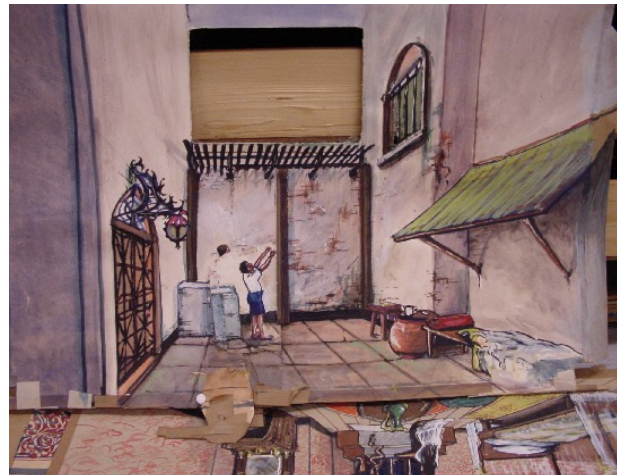
Papieren theater, Maarten Oostwoud Wijdenes (Collectie stichting Poppenspelcollecties)