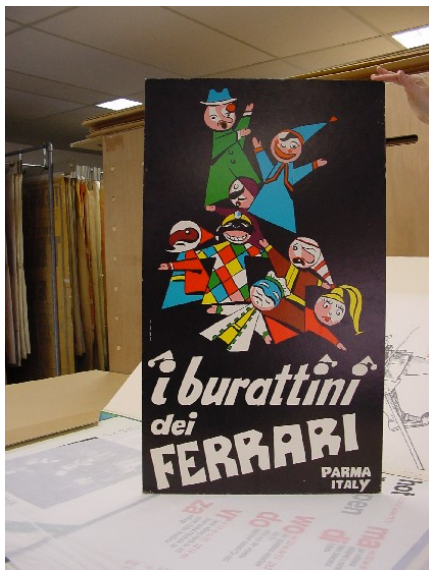
Affiche, Italië