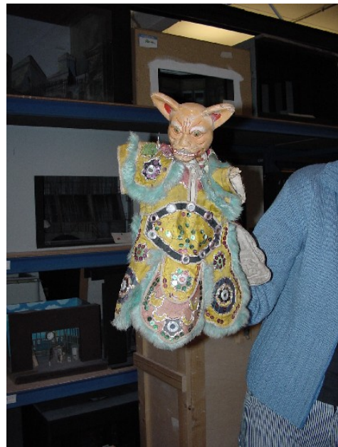
Chinese handpop (Collectie TIN)