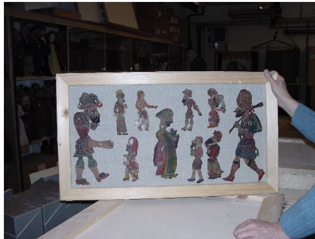
Turkse schimmen