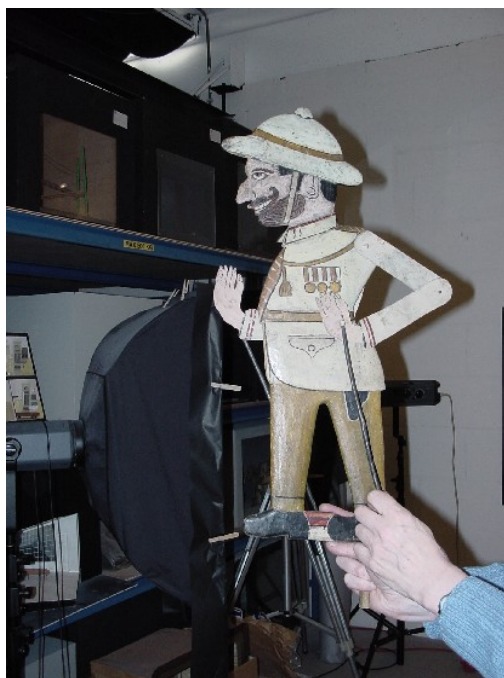
Wayang klitik figuren (Collectie TIN)