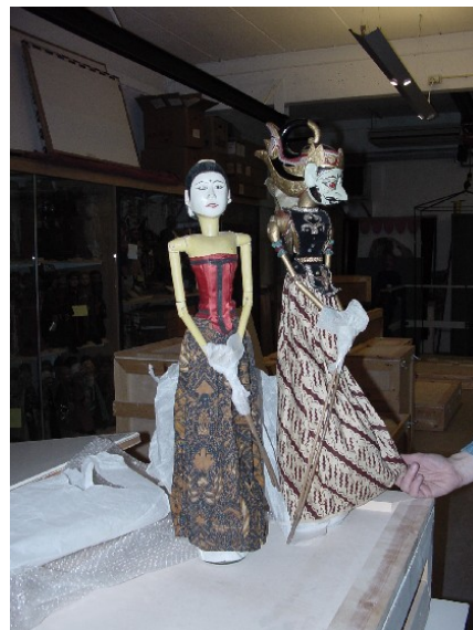
Wayang golek poppen (Collectie TIN)