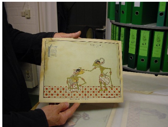
Wayang tekening (Collectie Poppenspe(e)lmuseum)