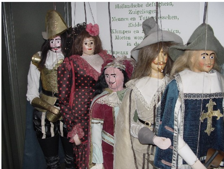
Brusselse stangpoppen