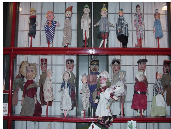
Jan Klaassen- en Katrijnfiguren (Collectie Poppenspe(e)lmuseum)

Het museum beschouwt de boeken en tijdschriften als integraal onderdeel van de collectie vanwege hun museale, antiquarische en uniciteitswaarde van (een deel van) deze deelcollectie.