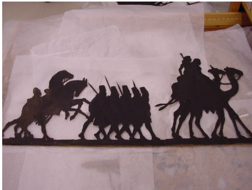
Schim, Ko Doncker (Collectie stichting Poppenspelcollecties)

De collectie bevat verder enkele papieren theaters, waarvan slechts een paar unica. Noemenswaardig is de collectie van Maarten Oostwoud Wijdenes (Meester Cornelis) die in de periode 1947-1970 in besloten kring voorstellingen gaf met zijn zelf gemaakte papieren theater.