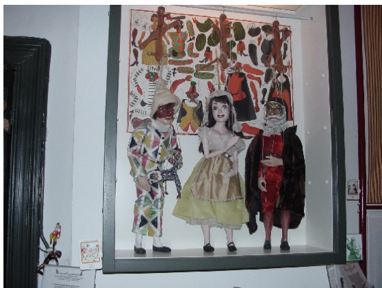
Commedia dell'Arte marionetten (Collectie Poppenspe(e)lmuseum)