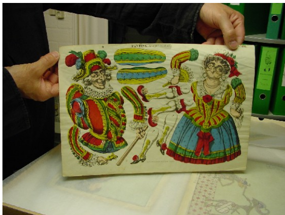
Pantin prent van trekpoppen (Collectie Poppenspe(e)lmuseum)

Het museum ontvangt 6 à 7000 bezoekers per jaar uit binnen- en buitenland. Het ontvangt geen structurele subsidie, maar doet wel regelmatig met succes een beroep op projectsubsidies. Het museum heeft drie vaste medewerkers, waarvan één fulltime (Van der Mieden zelf). De collectie groeit nog altijd door middel van schenkingen, aankopen en kunst opdrachten verstrekt door het museum; per jaar komen er circa honderd objecten en honderd boeken bij. Het Poppenspe(e)lmuseum voert een breed verzamelbeleid: het verzamelt niet alleen objecten en documentatie die direct op het poppenspel betrekking hebben, maar ook 'afgeleide' voorwerpen, zoals bijvoorbeeld een spaarpot in de vorm van het hoofd van mr. Punch. Deze deelcollectie parafernalia bevat zowel waardevolle zaken als objecten met voornamelijk documentaire waarde.