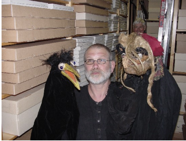
Paulus de Boskabouterpoppen, Jean Dulieu

van het poppenspel wordt verteld, werkt enthousiasmerend op de bezoeker. Minder goed vertegenwoordigd is het moderne poppenspelerfgoed; hedendaags materiaal ontbreekt volledig door gebrek aan middelen voor aankopen.