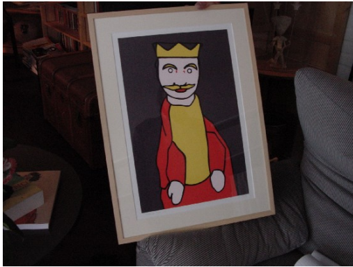
Zeefdruk, Wouter van Riessen (Collectie Poppenspe(e)lmuseum)