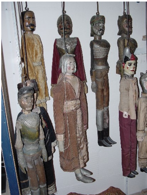
Luikse stangpoppen (Collectie TIN)