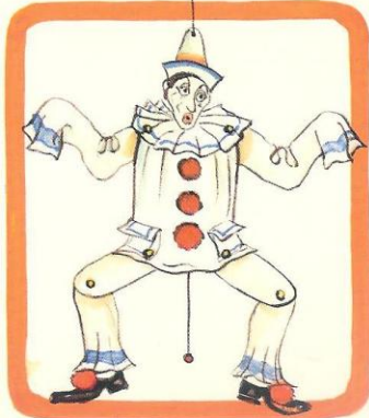
pierrot pulcinella brighella colombina