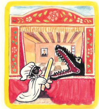
monster muis paardje slang