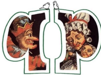
Vrienden van het Poppenspe(e)lmuseum Friends of the Dutch Puppetry Museum