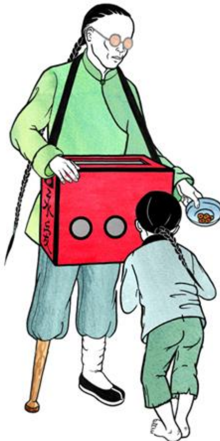
Afbeelding: straatentertainment door een blinde kijkkastman met zijn rarekiek. Illustratie: Elsje Zwart. Bijlagen I, II en III: extra afbeeldingen, beschrijving en verantwoording.

https://youtu.be/7bqeAHUnYEc (film expositie).